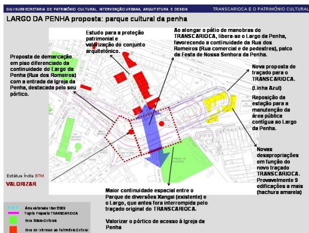
Figura 14: Proposta para mudança do traçado da Transcarioca

- O segundo legado, atualíssimo, se refere à preservação do patrimônio imaterial da festa. Em virtude da criação da Transcarioca, via que ligará a Penha à Barra da Tijuca, através de ônibus articulados em vias exclusivas, algumas alterações viárias foram previstas justamente no Largo da Penha, coração da festa, transformando-o no ponto final de retorno dos ônibus. Essa alteração romperia a ligação entre a Rua dos Romeiros e o portão de acesso ao santuário, afetando vários bens do patrimônio cultural e, principalmente, desconfigurando o território da festa. A Secretaria de Cultura elaborou relatório, solicitando a modificação do traçado da via, ix reconhecendo a festa como patrimônio cultural da cidade, bem como a importância de sua continuidade no local. Dessa forma, igualmente se reconhecem as duas facetas da festa, tanto a conectividade entre a Rua dos Romeiros e a Igreja, como também a importância da manutenção do suporte espacial principal da festa “profana”, o Largo da Penha (fig. 14).